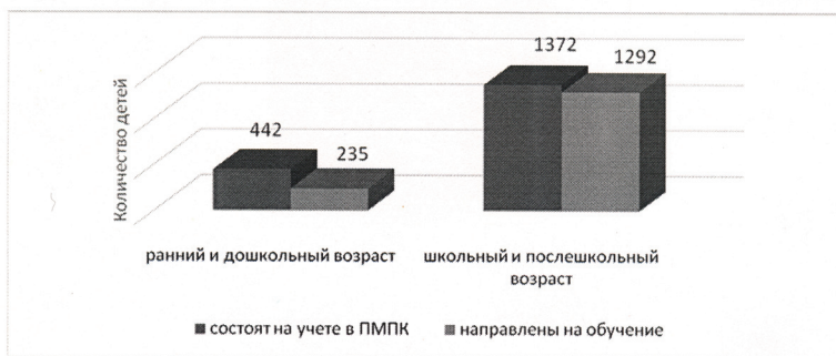
Рисунок 1 – Соотношение количества неслышащих детей, состоящих на учете в ПМПК и направленных на обучение в организации образования