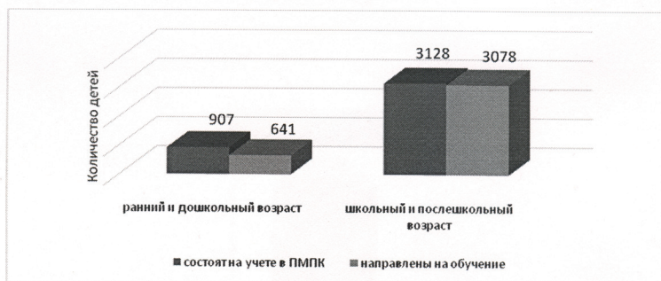
Рисунок 2 – Соотношение количества слабослышащих детей, состоящих на учете в ПМПК и направленных на обучение в организации образования